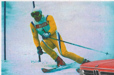
Ingemar Stenmark (o.), Che Guevara, BMW 2002.

Der beste Snowboarder aller Zeiten? Terje Håkonsen, der einflussreichste Athlet und der erste Superstar der Snowboard-Geschichte. Ihr erster Wagen? Ein roter BMW 2002, Baujahr 1972 - ein echter Klassiker.